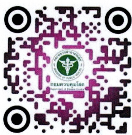
QR code ลงนามปฏิญาณตน