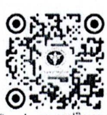
QR code ลงนามปฏิญาณตน

นายสุทธิพงษ์ จุลเจริญ ปลัดกระทรวงมหาดไทย